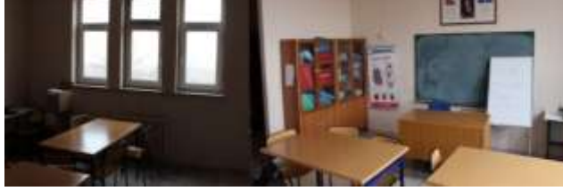
Şekil 3. Sınıfın Işık Düzeni

göstermektedir. Bu nedenle az gören öğrencilerin görme düzeyleri dikkate alınarak sıra ve tahtanın konumu düzenlemesi ile ışık ve perde düzenlemeleri yapılmalıdır.