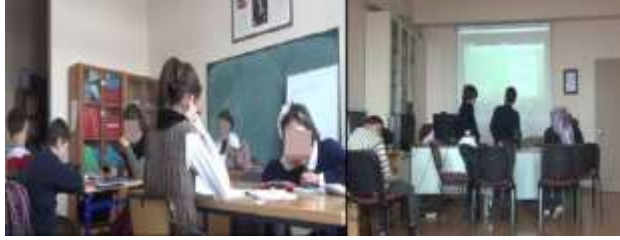
Şekil 2. Projeksiyon Aleti Eksikliği ve Bilgisayar Sınıfı

öğrencilerin projeksiyon perdesi yakınına oturma gerginliği vb. durumlar oluşmaktadır. Bu sebeple öğrenci dikkatleri dağılmakta ve her öğrenci farklı şeylerle ilgilenmektedir. Ayrıca yapılan etkinliklerin az gören öğrenciler tarafından daha iyi öğrenilmesi için yapılan etkinliğin büyük halini görebilmesine yardımcı olabilecek kamera, projeksiyon aleti ve tablet gibi az gören öğrencilerin öğrenmesini kolaylaştıracak alternatif öğrenme materyallerinin sınıf ortamında bulunması gerekmektedir. Bu sayede az gören öğrencilerin bireysel ihtiyaçları karşılanmış olur ve öğrencilerin ilgilerinin artacağından kavramların hatırlanması kolaylaşır (Özdemir, 2011).