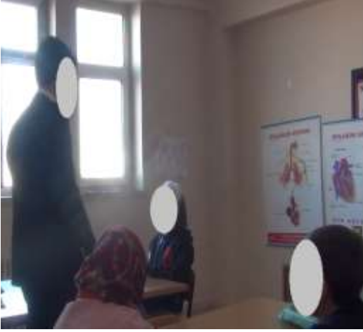
Tablo 5. Öğrenci cevaplarına öğretmenin dönüt vermemesi

Öğretmen: “ Şimdi konuyu anlayıp anlamadığınıza bakalım.