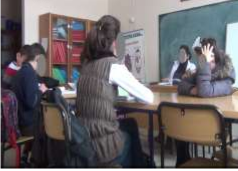
Tablo 3. Derse hazırlıksız gelme durumu

Öğretmen: “yoğunluk ne demektir bilen var mı?” Ö1: “bunu mu işleyecektik ki bugün?” Öğretmen: “Ö2 cevaplasın.” Ö2: “öğretmenim mesela yoldan araba çok geçiyorsa yoğundur.” Öğretmen: “Ö4 sence nedir yoğunluk?” Ö4: “ıyy vallahi ben çalışmadım. Bilmiyodum konuyu.” Öğretmen: “çalışman lazımdı. Ö5 sen söyle bakalım.” Ö5: “çalışın demediniz ki.”