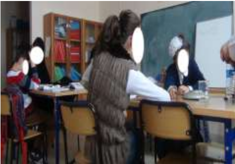
Tablo 2. Etkinliklerde sözel betimlemelere yer verilmemesi

Öğretmen derse gelirken beher, pamuk, ısıtıcı ve bir şişe su getirmiştir. Etkinliğin nasıl gerçekleşeceği ile ilgili bilgi vermeden etkinliğe geçmiş ve az gören öğrencilerin etkinliği görmesi sağlanmıştır. Fakat öğretmen sözel betimlemelere yer vermeden belirli bir süre sonra görmeyen öğrencilere pamuk yukarı çıkıyor görüyorsunuz değil mi demiş?