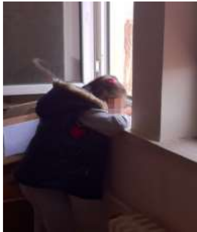
Şekil 4. Ortam ışığının az görenlerin görmesine göre yetersizliği